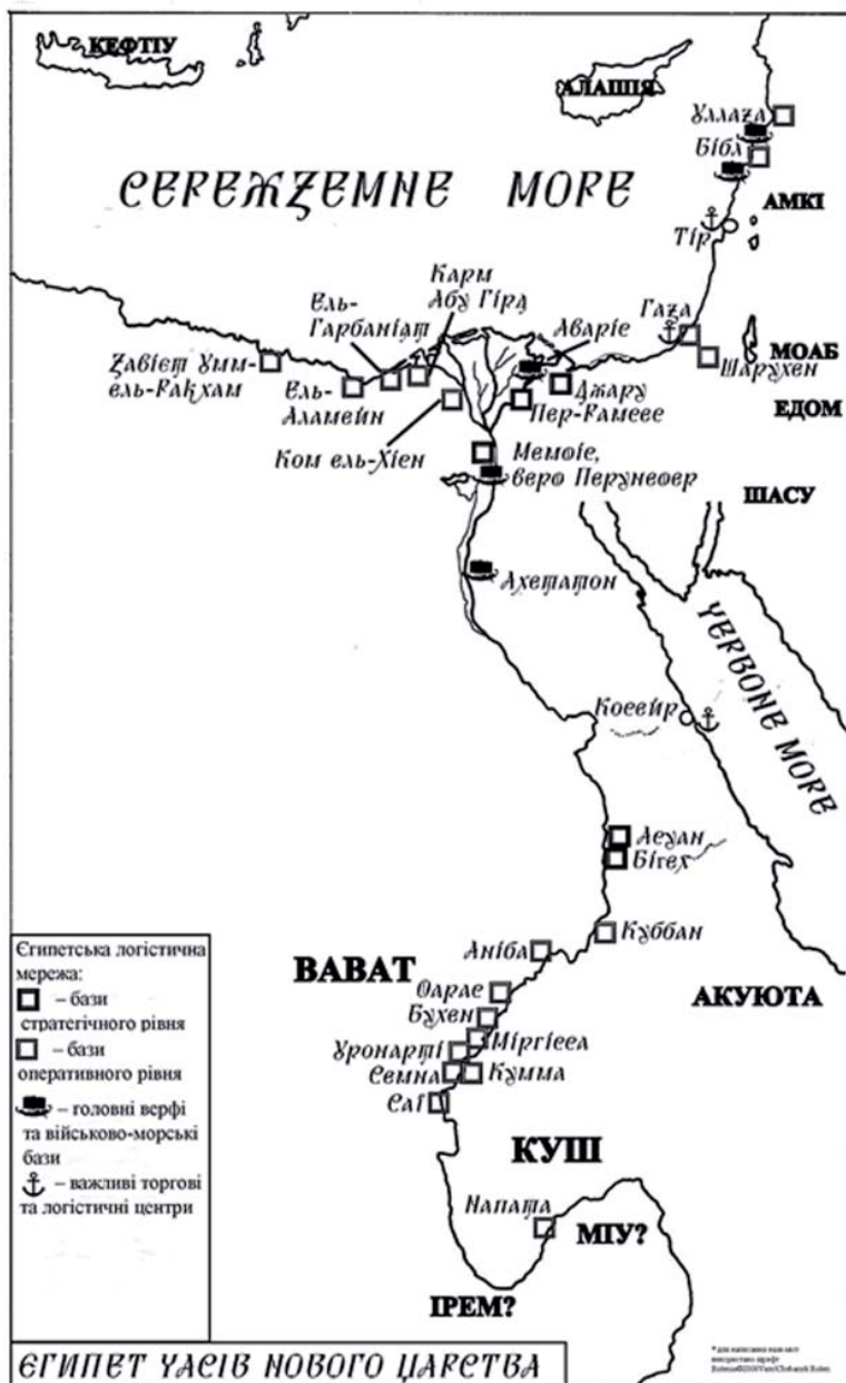
Рис. 2. Мапа єгипетської логістичної мережі часів Нового царства