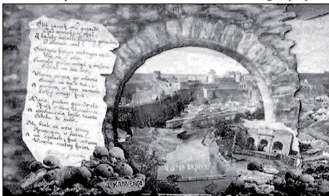
Рис. 3. Листівка-колаж 2