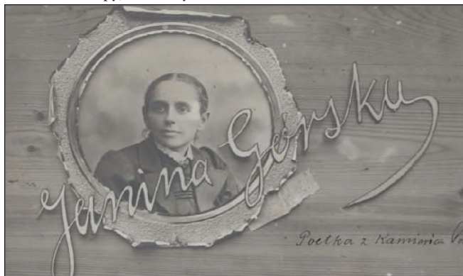
Рис. 4. Листівка-колаж з портретом поетеси Я. Гурської

Ще одна поштівка (рис. 4), датована 1906-м р., має фон дерев'яної дошки, на якій у стилізованій круглій рамці вміщено жіночий портрет із написом «Janina Górska», виконаним із художнім смаком. Праворуч трохи неохайним почерком написано: «Poetka z Kamińca Pod.». З-під рамки видно стилізований клаптик паперу, на якому ледь помітно виведено: «L. Rakowski» [15].