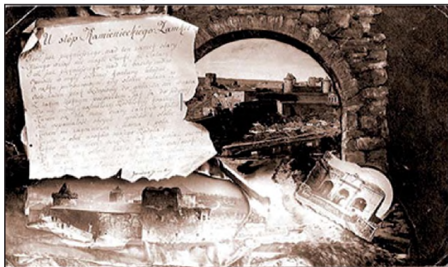
Рис. 2. Листівка-колаж 1