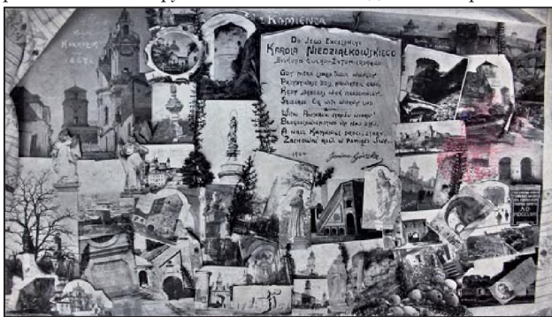
Рис. 5. Фотографія-колаж

У фондах Кам'янець-Подільського державного історичного музею-заповідника ми виявили фотографію авторства Л. Раковського, наклеєну на велике паспарту (рис. 5). Це фотоколаж із 43 зображень історичних пам'яток Кам'яня-Подільського, кожне з яких має підпис. У центрі вгорі є напис («Z Kamińca»), а нижче на імпровізованому клаптику паперу – вірш поетеси Яніни Гурської «Do Jego Excelencyi Karola Niedzialkowskiego biskupa Lucko-Zytomierskiego», датований 1904-м роком. У лівому нижньому куті є фото Леона Раковського з його власноручним підписом. Уся композиція оформлена вишитим рушником із типовим подільським орнаментом [12].