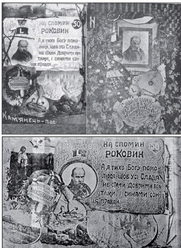
Рис. 7. Перевидана серія листівок в честь 50 роковин смерті Т.Г. Шевченка