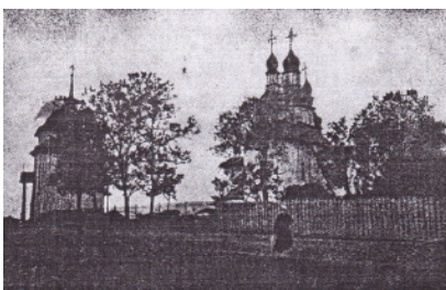
Світлина № 3 «Московський синодальний стиль. Вознесенська церква в м. Брусиліві, збудована 1846 року замість погорілої старої українського стилю».