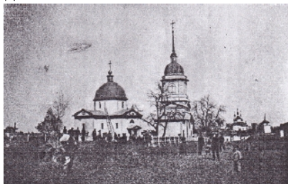
Світлина № 2 «Український церковний стиль. Воскресенська замкова церква в м. Брусиліві, збудована 1711-1738 рр».