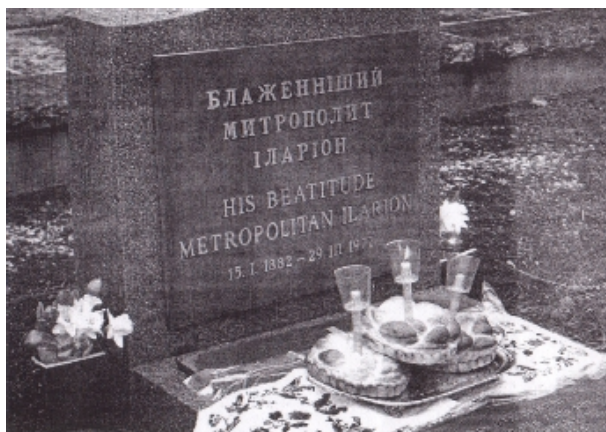
Фото надгробку Митрополита Іларіона у Вінніпезі на цвинтарі Глен Іден.