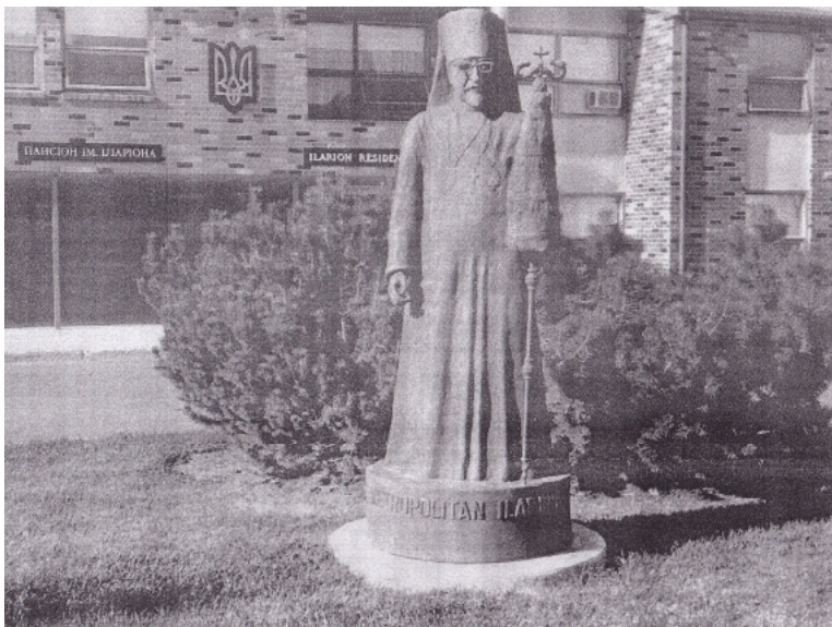
Пам'ятник Митрополитові Іларіону перед пансіоном імені Іларіона в Саскатуні (автор В. Епп)