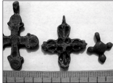
Рис. 1. Хрестики часів Київської Русі, знайдені на місці літописного Здвиженська протягом 2013-2015 рр.