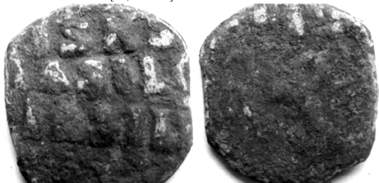
Рис. 2. Візантійська монета «фоліс», знайдена на місці літописного Здвиженська 2014 року

писну річку. Це було типове острівне (мисове) поселення, яке займало площу близько 20 га. Отже, місто було велике, понад 15-20 великих будинків з прибудовами, сараями, конюшнями. Виходячи з висновків П. Толочка відносно густоти населення міст Київської Русі, згідно з якими на 1 га проживало в середньому 125 людей, отримуємо, що населення давнього Здвиженська становило щонайменше 2500 осіб [24, с.54-57].